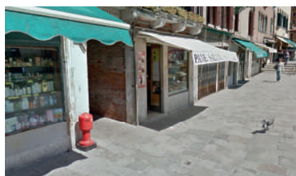
Sotoportego Ca' Pozzo