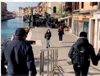
Svolta a sinistra una volta attraversato il Ponte delle Guglie