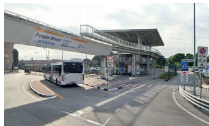
People Mover - Marittima