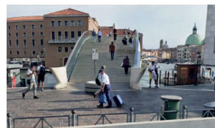
Ponte della Costituzione (Calatrava)

Da qui potete prendere il vaporetto o continuare a piedi.