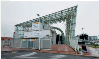
People Mover - Tronchetto

Prendete la monorotaia People Mover e scendete alla fermata "Piazzale Roma", ultima fermata della linea (Tronchetto - Marittima - Piazzale Roma).