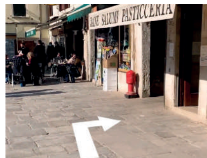
Sotoportego Ca' Pozzo sulla destra, di fianco al panificio